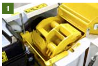
1- COMPACTE TRECHTER met brede aanvoerwals