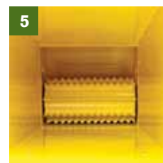
5- AANVOERWALS MET VERTICALE GELEIDING