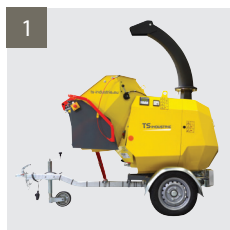
1 - ULTRA COMPACT pour le transport.

UNE MACHINE PUISSANTE, COMPACTE DE MOINS DE 750KG, IDÉALE POUR LES ÉLAGEURS