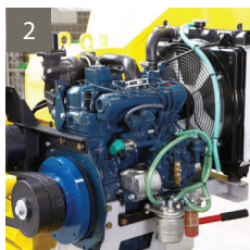
2 - MOTEUR KUBOTA D1105T 34 CV / 25,35 kW – 3 Cyl.