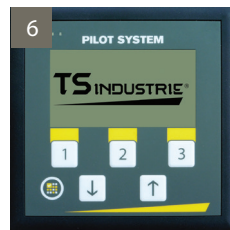
6 - PILOT SYSTEM. Centralisation du pilotage et du contrôle de la machine.