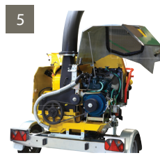
5 - CAPOTS DE SERVICE pour un accès aisé et rapide à tous les points de maintenance.