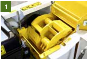
1- KOMPAKTER TRICHTER mit breiter Einzugswalze

KLEIN UND HANDLICH, DAMIT ERREICHEN SIE AUCH DIE ENGSTEN STELLEN